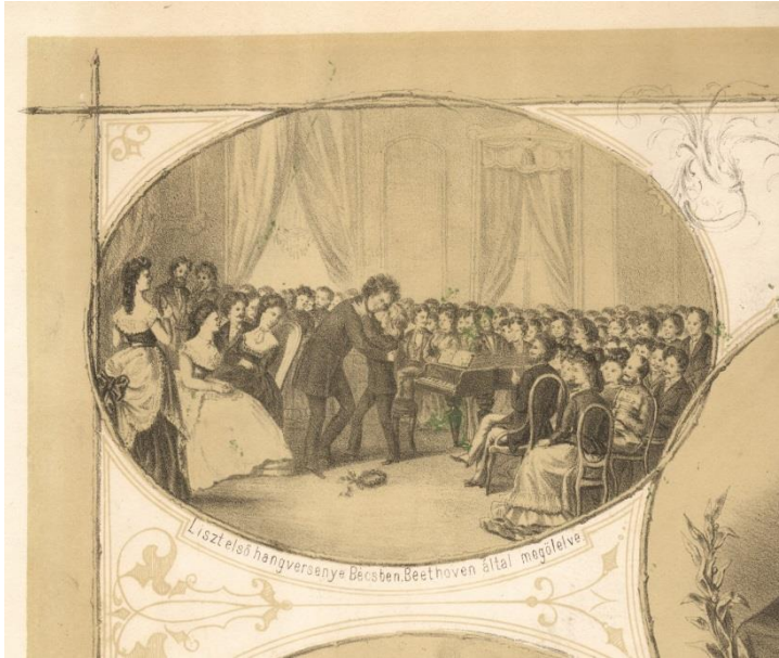
Ismeretlen művész: Emlék Liszt Ferenc ötvenéves művészi jubileumára 1873-ban, részlet (a „Homlokcsók”), színezett litográfia, nyomtatta és kiadta Halász István, Pest

Az emléklapett Liszt karrierjének 50 éves évfordulójára készült, melyen valós és fiktív jelenetek keverednek. Az egyik ovális jelenet egy koncertet ábrázol, mely 1823. április 13-án délelőttjén valóban megtörtént a bécsi Kis-Redout-teremben. Liszt ezt az időpontot tekintette karrierje kezdetének.