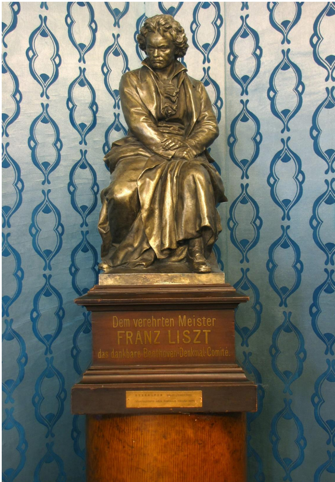
Kaspar Clemens von Zumbusch, Beethoven alakja a bécsi Beethoven-emlékműhöz, 1877-1878 körül, a bécsi Beethoven Emlékbizottság ajándéka Lisztnek