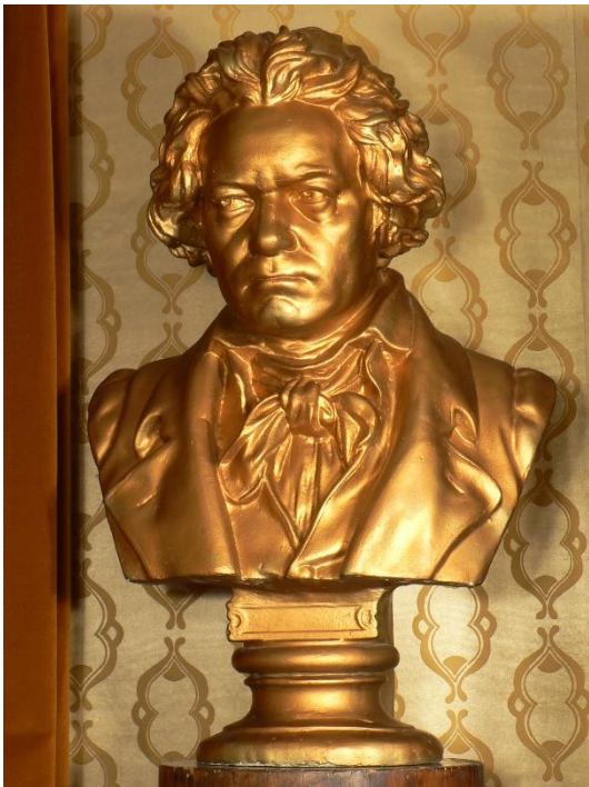
Hugo Hagen: Ludwig van Beethoven mellszobra, aranyozott gipsz, 1900 vagy 1909

interpretátora lett. Kortársai szerint utolérhetetlenül játszotta szonátáit és nagyon sokat tett azért, hogy a zeneszerző neve és zenéje méltóképp maradjon fenn a 19. század második felében. Az 1840-es évektől Liszt karmesterként számos alkalommal előadta Beethoven szimfóniáit, nem mellékesen pedig elkészítette azok zongoraátiratait. Forradalmian bátor dolognak számított, hogy 1836-ban – amikor Beethoven zenéje kevéssé szerepelt hangversenyműsorokon – nyilvánosan eljátszotta a Hammerklavier-sonátát.