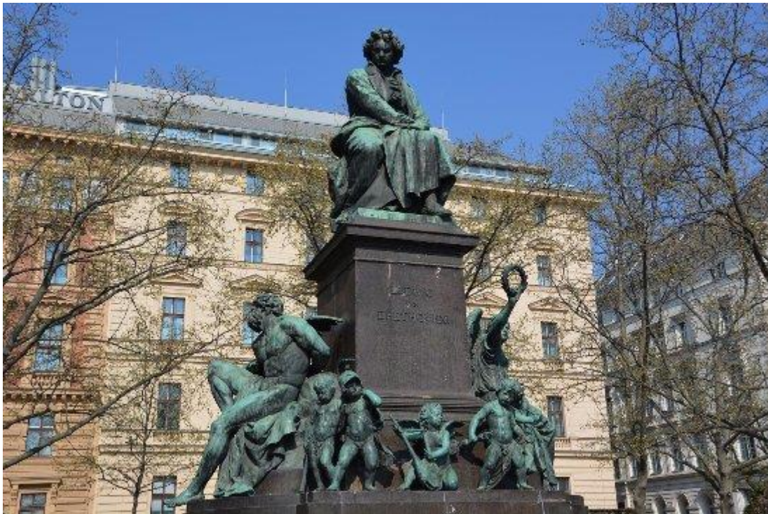
Kaspar Clemens von Zumbusch: Beethoven emlékmű, Bécs, 1878

Beethoven alakjának ábrázolása tudatosan utal Michelangelo Mózesére (San Pietro in Vincoli Bazilika). Zumbusch nemcsak a bibliai alakhoz való hasonlósággal szerette volna kifejezni Beethoven nagyságát; gazdag allegóriai együttes veszi körbe a talapzatot: Beethoven szimfóniáit puttók testesítik meg, az együttest Prometheus és Niké alakja egészíti ki, ami az emlékművet a barokk óta érvényes nyilvános uralkodói ábrázolások ikonográfiai hagyományához kapcsolja. Liszt maga „ pompás műremeknek ” tartotta, „ amely a városnak és Zumbusch szobrászművésznek egyaránt maradandó tiszteletére válik ”.