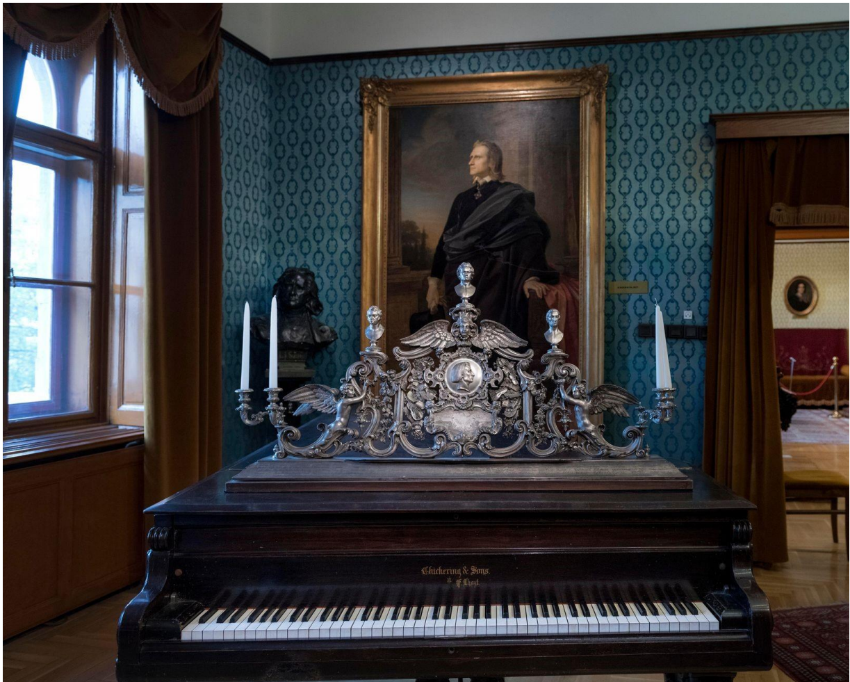
Kottatartó Liszt tulajdonából, ezüst, 1858, Bécs

A szalonba belépve jobb oldalon egy 1880-as Chickering zongorát láthatunk. A hangszer már önmagában lenyűgöző szépségű, de a rajta látható ezüst színű kottatartóval egészen fenséges hatást kelt. A kottatartón három, Liszt által nagyra becsült, példaképként tartott zeneszerző (Schubert, Beethoven, Weber) apró büsztje látható. A kottatartó egyébként a Magyar Nemzeti Múzeum tulajdona és eredetileg azon a Broadwood zongorán állt, amelyen Beethoven, majd később Liszt is játszott. Az angol cég által gyártott zongora ma is a Magyar Nemzeti Múzeumban látható.