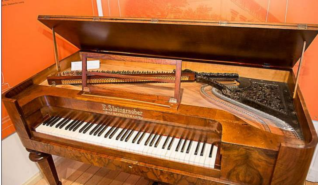
Wagner színpadi zongorája