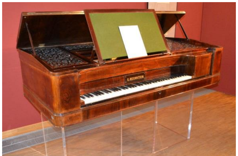
Wagner komponáló íróasztala

Visszatérve a komponáló íróasztalhoz, nem tudunk arról, hogy Bösendorfer más hasonló hangszerrel kiegészített asztalt készített volna bárki számára, az viszont ismeretes, hogy Richard Wagnernek is volt komponáló íróasztala, amelyet most a lipcsei Városháza Múzeum őriz. Ezt a komponáló íróasztalt Wagner 54.