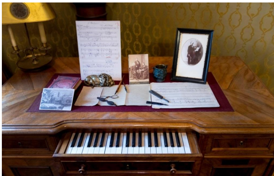
A komponáló íróasztal billentyűsora

Ignaz Bösendorfer 1828-tól kezdett zongorákat készíteni Bécsben. Mivel zongorái olyan erősek voltak, hogy a virtuóz Liszt hangversenyein sem szakadtak el húrjai, 1830-ban